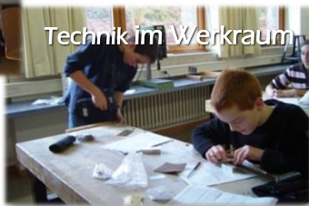
Technik im Werkraum