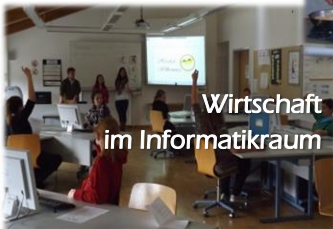
Wirtschaft im Informatikraum