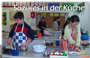
Soziales in der Küche